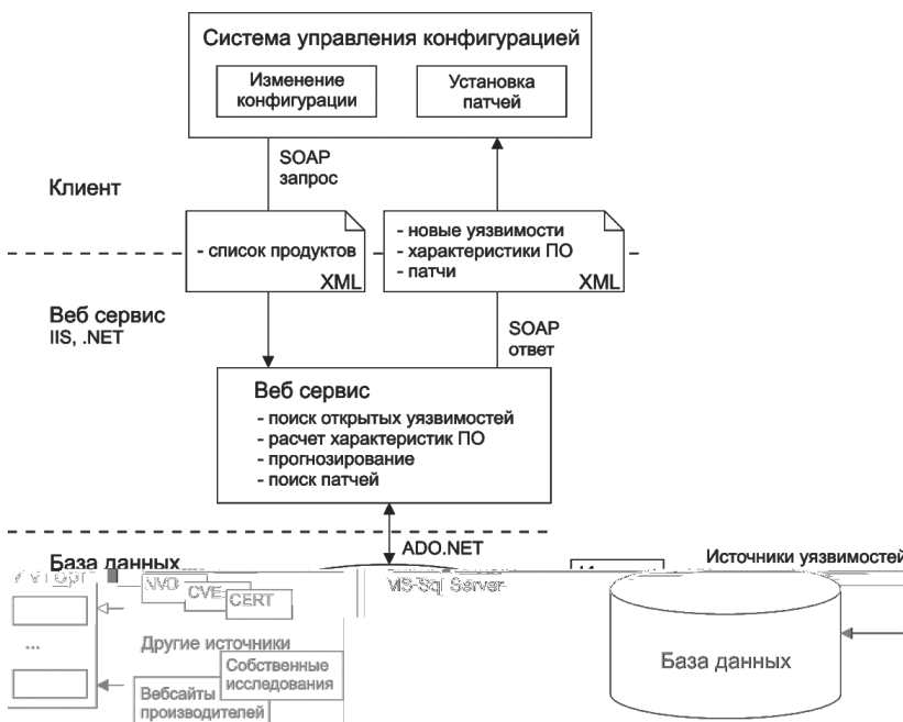
Рис. 3. Архитектура разработанного веб-сервиса