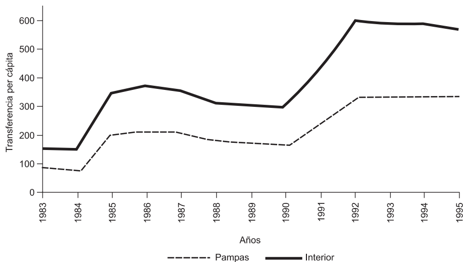
FIGURA 1. RECURSOS DE LA COPARTICIPACIÓN FEDERAL DE IMPUESTOS TRANSFERIDOS A LOS GOBIERNOS DE LAS PROVINCIAS EN ARGENTINA (1983-1995) (TRANSFERENCIAS PROMEDIO PER CÁPITA ENTRE PROVINCIAS)

Fuente: Basado en datos recopilados de la Subsecretaría de Asistencia a las Provincias y la Dirección Nacional de Coordinación Fiscal con las Provincias.